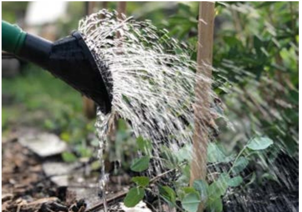
Geef alleen water als het echt nodig is

Onkruid hoeft niet altijd meteen op de composthoop te belanden. Je kunt de planten vaker voor iets gebruiken dan gedacht. Zoek eens de geneeskrachtige waarde van zo'n (on)kruid op. Bijvoorbeeld