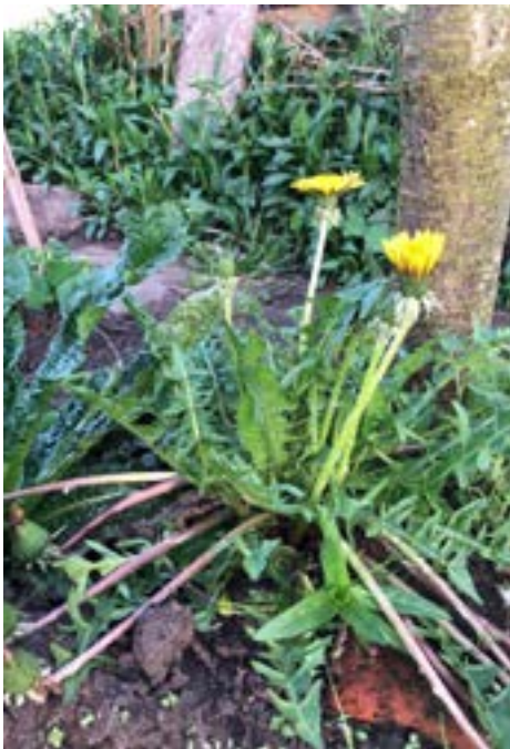
Van paardenbloemen kan je siroop maken

Planten groeien, geven vruchten, sterven en vergaan. Wormen maken er compostaarde van en zo kan de cirkel weer opnieuw beginnen.