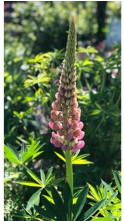
Lupine trekt insecten aan en verrijkt de grond

Toen ik in maart mijn composthoop leeghaalde en de rijke aarde over de tuin verdeelde bedacht ik dat er eigenlijk geen afval bestaat in een tuin. Alles wat daar is gaat rond. De tuinder doet niet anders dan het heen en weer brengen van natuurlijke grondstoffen. Er is niks wat je echt hoeft weg te gooien.