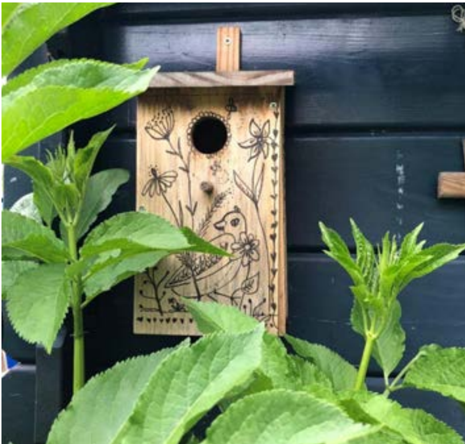
Trek vogels naar de tuin