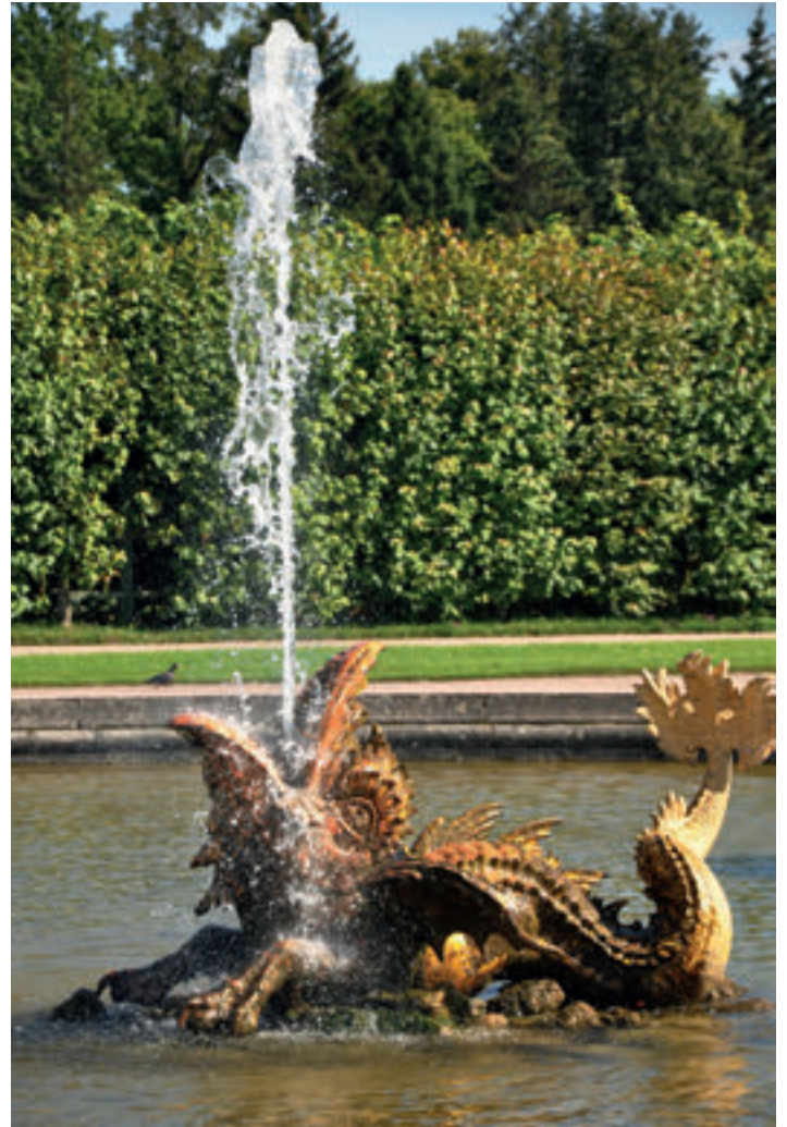
Voorkom een spuitser na de winter

kermissen en was je ziek of had je klachten moest je thuisblijven en je laten testen. Wat een rare toestand! Gelukkig mocht er, stukje bij beetje, steeds meer maar de anderhalve meter bleef bestaan. Zelfs onze kantine ging open er waren heerlijke maaltijden te krijgen en natuurlijk patat en kroketten. En dan de Olympische Zomerspelen in Japan! Wat een succes en een vreugde was het daar in Tokio! Nooit eerder werden er zoveel medailles gewonnen, het oude record van 25 medailles in 2000 in Sidney werd verpulverd en op 36 stuks gezet. Ongekend wat in die 16 dagen daar is gebeurd. En zo ging ook dit tuinseizoen voorbij en worden de dagen weer geleidelijk aan korter. En dat is goed te merken ook. Vandaag, zaterdag 4 september, komt de zon om 7 uur op, alweer 2 uur later dan in juni en gaat deze onder om even voor half 9 ruim 1 ½ uur eerder. Nog een maandje, dan is het open tuinseizoen 2021 helaas alweer voorbij en moeten we weer enkele belangrijke zaken regelen.