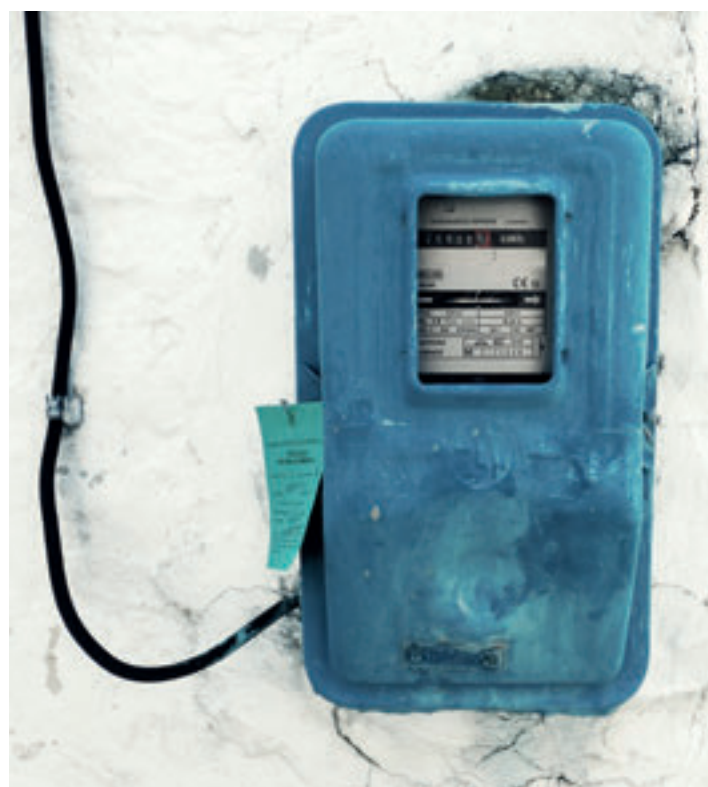
De elektriciteitsmeters op de Federatie zijn niet zo ouderwets

Zodra er een vorstperiode aanbreekt bevriest de waterleiding meteen. Ook de afgelopen winter was het weer op enkele tuinen raak. Op het moment zelf lijkt er nog niets aan de hand, maar zodra de dooi inzet, zijn de rapen gaar en springen de leidingen open. Wij kenners spreken dan van een 'spuiter'. Met een zichtbare spuiter is het probleem snel opgelost, maar spuit het water de grond in, dan kan het ook weken later pas zichtbaar worden, en al die weken lopen