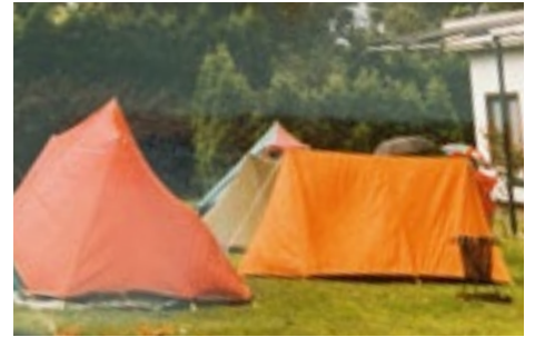
Tentjes op het speelveld