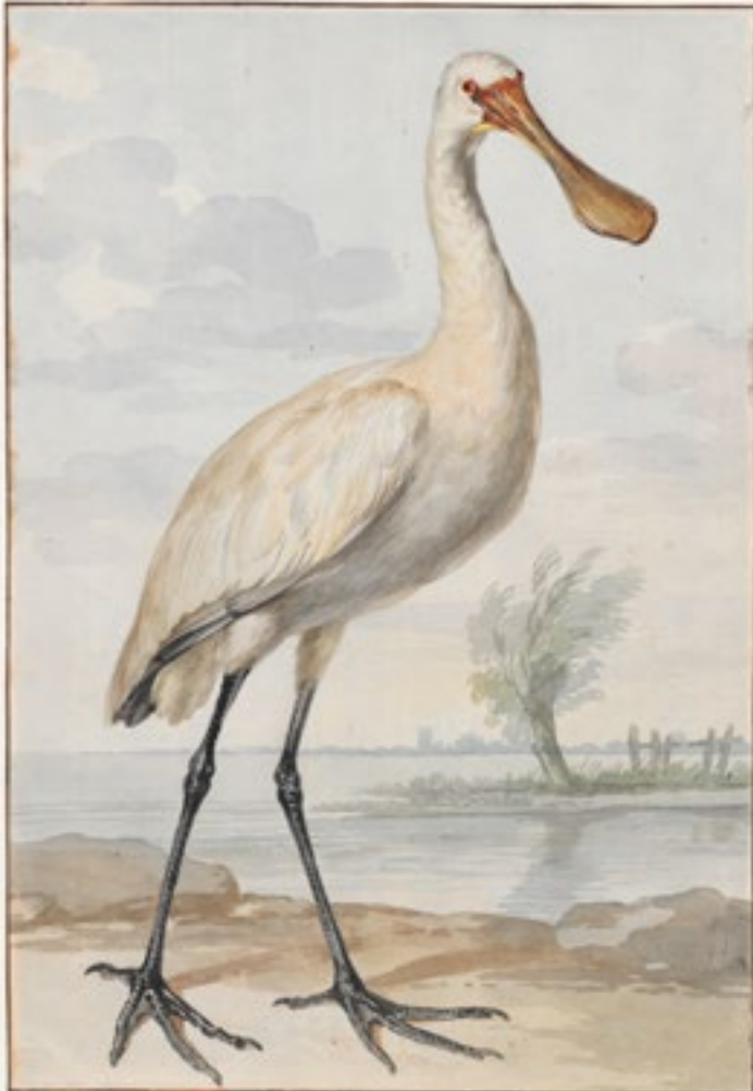
Gravure door Aert Schouman (1756)

De lepelaar is ongeveer 85 cm lang en heeft een spanwijdte van ongeveer 130 cm. Deze steltloper is van tijd tot tijd foeragerend te zien in de slootjes van de ons omringende weilanden. Ze nestelen in bomen of riet en soms ook op de grond. Het nest bestaat uit riet en twijgen en bevat gewoonlijk 4 eieren, die met tussenpozen van meerdere dagen worden gelegd. Beide partners broeden en na drie weken komen de witdonzen kuikens te voorschijn met korte bijna normale snavels.