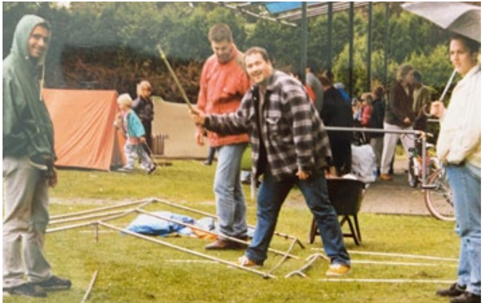
De regen houdt ons niet tegen