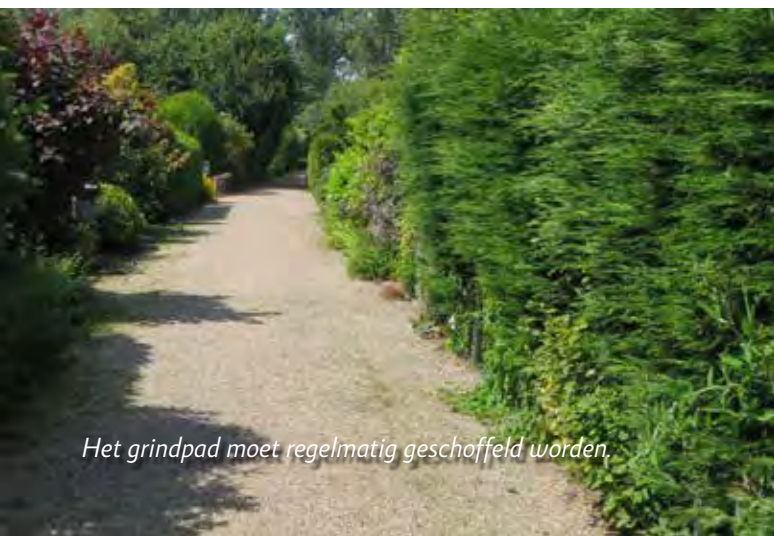
Het grindpad moet regelmatig geschoeffeld worden.

Toch is het volgens mij geen gek idee om eens te kijken of er niet meer het principe “gelijke monniken, gelijke kappen” kan worden gehanteerd.