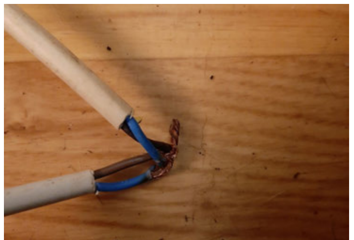
Half versmolten verbinding...