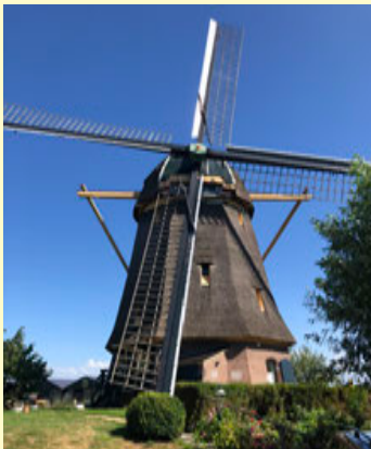
Molen ‘De Zwaan’

vee dat de schaduw zoekt; Holland zoals we dat van Ot en Sien kennen. Om het nog Nederlandse te maken zien we even verderop een achtkantige imposante molen uit 1638 met de mooie naam “De Zwaan”.