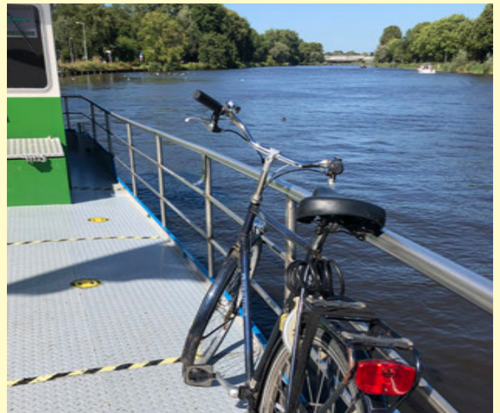
Overvaren met het pontje

Pal hier tegenover is dan wederom de pontveer. Die kan je dan nemen om ook het “watergevoel” te beleven in je tochtje.