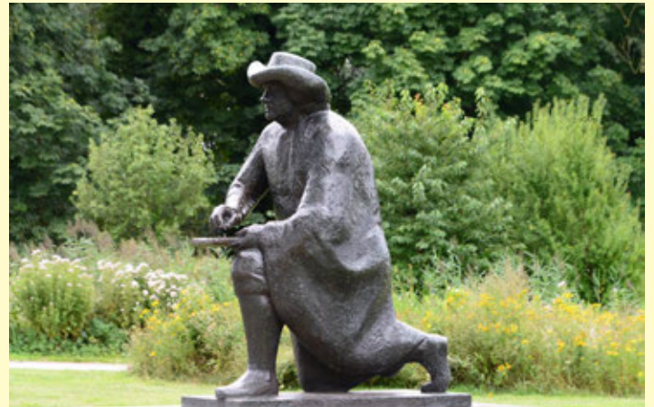
De schetsende Rembrandt bij de Riekermolen

Als je doorfietsd kom je langzaam aan in de buurt van het Amstelpark. Daar staat het monumentale beeld van een schetsende Rembrandt en daarachter de Riekermolen.