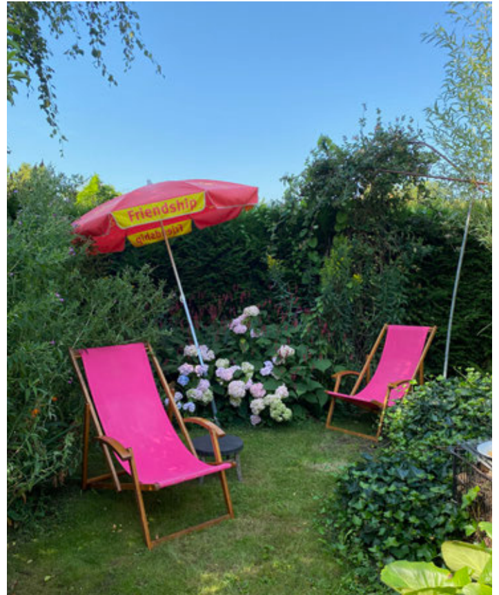
Anderhalve meter afstand, ook in de tuin

En zo ging ook dit tuinseizoen voorbij en worden de dagen geleidelijk aan korter. Dat is goed te merken! Wist u dat op de langste dag van het jaar, 21 juni, de zon al om 5.18 uur opkomt en om 22.04 uur pas ondergaat, terwijl het nu, na de maanden juli en augustus, al ruim drie uur korter licht is overdag? Nog maar een maandje, dan is het tuinseizoen 2020 helaas alweer voorbij en moeten we, zoals ieder jaar, weer een aantal enkele belangrijke zaken regelen.