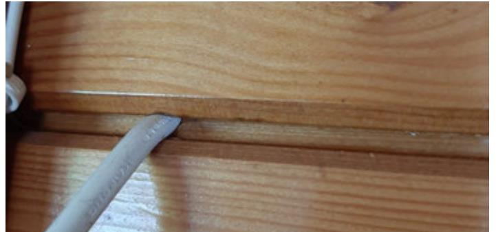
Werkend hout knelt snoertjes af!

Los van de geïmproviseerde verbinding zat er in het huisje trouwens nóg een riskant snoertje, strak tussen twee houtdelen in geklemd. "Maar hout werkt",