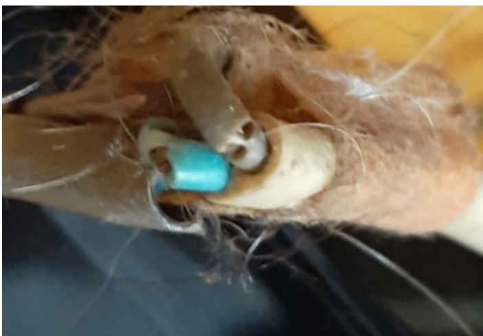
Half vergaan pleistertje biedt géén veiligheid...