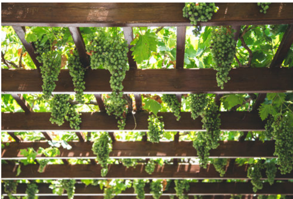
Een pergola begroeid met wijnranken: schaduw én misschien een flesje wijn...

de (on)mogelijkheden van een overkapping