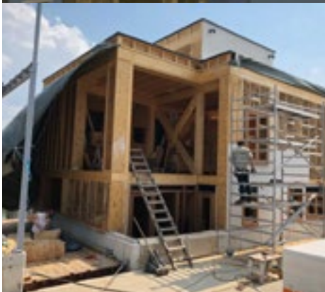
Drijvende strowoning (2018–2019) Stro gebruikt voor: wanden