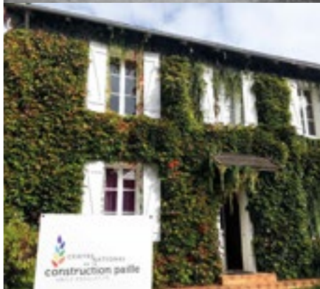
Oudste strobalehuis van Europa, sinds 2019 een Rijksmonument

Aan de Waal in de Nijmeegse wijk Lent staat sinds kort het grootste strobouwproject van Europa. Het drie en vier etages hoge houten appartementencomplex is gebouwd op initiatief en met hulp van de bewoners.