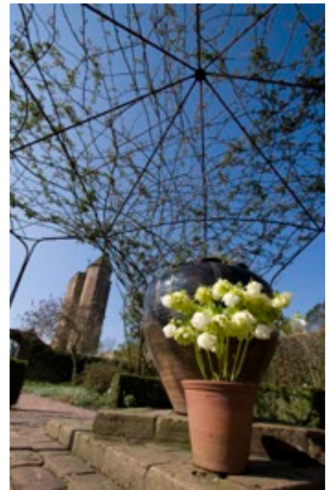
Potten in de Witte tuin