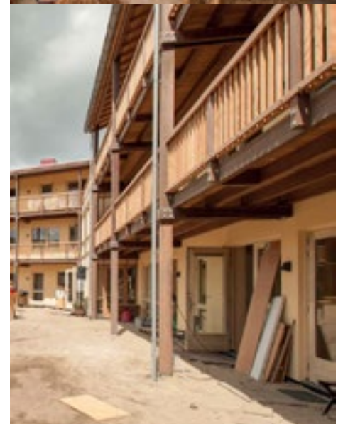
Strowijk aan de Waal in Lent, Nijmegen Sociale huurwoningen