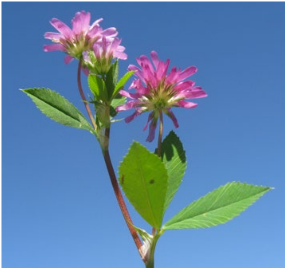
Perzische klaver (Trifolium resupinatum)