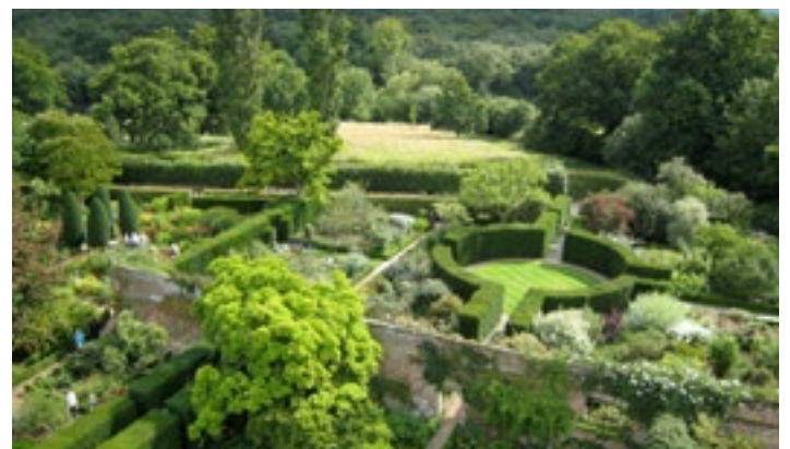
Een overzicht van de verschillende 'tuinkamers'