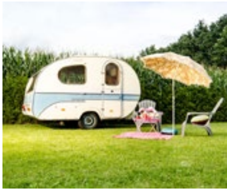
Jaren 50 sleurhut

Verblijf in een stacaravan heet ook recreëren, zoals door enkele toehoorders werd opgemerkt en is vergelijkbaar met onze huisjes op de Federatie. Het concept Tiny House is voor de echte Eco-fetisjisten. Ik juich niet elk modernisme toe. In de jaren 50 hokten gezinnen van 6 personen of meer op een nog kleiner oppervlak dan de huidige 28m 2 , maar tijden veranderen, dus ook de visie op leefruimte van een woonverblijf.