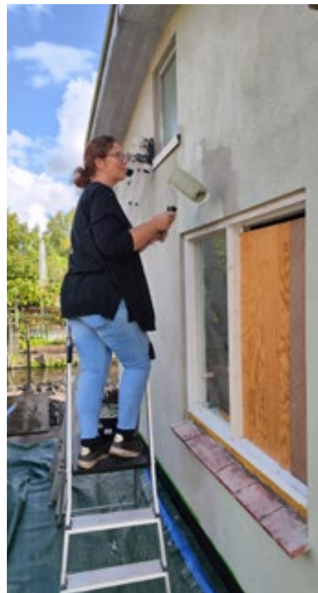
Het opknappen is in volle gang!

Ook ken ik ondertussen de geschiedenis van het tuinhuis dat wij hebben gekocht. Het is te mooi! Wij zijn ontzettend blij dat we dit tuinhuis opknappen en er straks, net als de vorige bewoners, lang van mogen genieten.